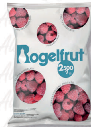
LAMPONI INTERI Cod. 317 | 2,5 Kg