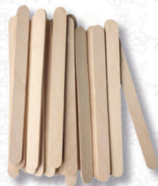
STECCHO LEGNO PER GELATO Cod. 0008671 | Conf. da 50 pezzi