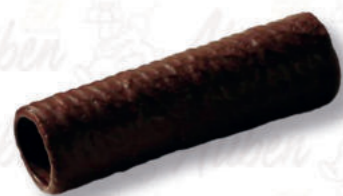
CANNOLI 19/10 RICOPERTI Cod. 0004083 | 2,8 Kg Peso al pezzo: 22 g N° pezzi per confezione: 126

Lo sciroppo di glucosio disidratato, derivato dall'amido di mais, è un anticongelante con basso potere dolcificante, ottimo per la gelateria dove ottimizza il controllo dell'acqua in mantecazione. La sua forma in polvere consente un dosaggio preciso e una facile solubilità. Migliora l'estrusione, la finezza dei cristalli e la stabilità. È impiegato anche in pasticceria e come lucidante. Si conserva per 24 mesi in luogo fresco e asciutto.