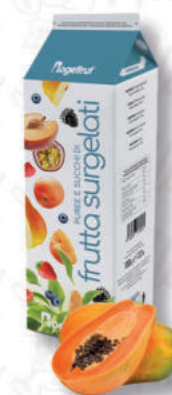
PUREA PAPAYA Cod. 0008738 | 1 Kg