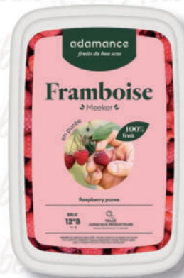
PUREA LAMPONE Cod. 0009337 | 1 Kg