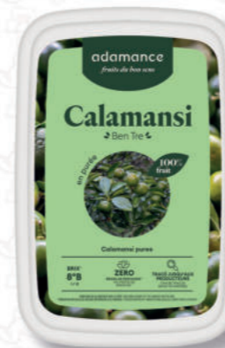
PUREA CALAMANSI Cod. 0010314 | 1 Kg