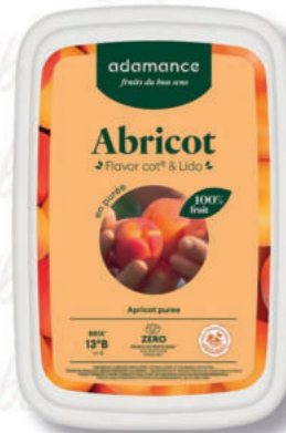
PUREA ALBICOCCA Cod. 0009332 | 1 Kg

Coltivata con pratiche eco-responsabili, Adamance nasce nella cioccolateria Valrhona, nel cuore della Valle del Rodano, per rispondere alle esigenze di chi di pasticceria è davvero esperto.