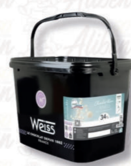
BIANCO ANEO 34% Cod. 0007666 | 5 Kg

Un'eccezionale copertura al latte frutto di un blend di quattro grandi varietà di cacao. Al palato, le note lattiche e fresche si combinano con un marcato gusto di cacao.