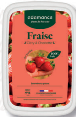
PUREA FRAGOLA Cod. 0009335 | 1 Kg