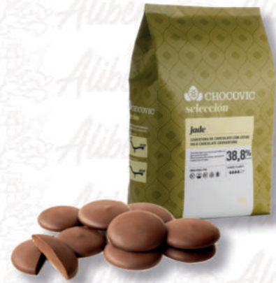
JADE CIOCCOLATO AL LATTE 38,8% Cod. 0004880 | 5 Kg

La storia di Rogelfrut inizia nel 1987, da oltre 40 anni uno dei leader in materia di succhi e puree di frutta. Un grande assortimento di gusti, da quelli tradizionali a quelli innovativi. Da sempre la frutta è alla base del settore gelateria e pasticceria, trovando spazio nei bar, ristoranti e anche nei reparti bakery.