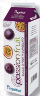
SUCCO PASSION FRUIT CONCENTRATO Cod. 0004639 | 1 Kg