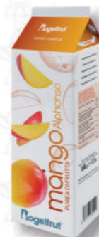
PUREA MANGO Cod. 445 | 1 Kg