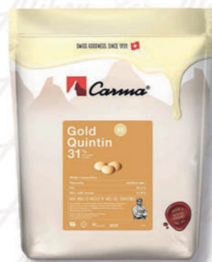
GOLD QUINTIN 31% Cod. 0009409 | 1,5 Kg

Senza coloranti o aromi artificiali. Un bel colore dorato con un fantastico gusto caramello fatto con amore e dedizione.