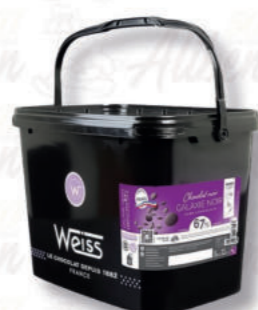
GALAXIE FONDENTE 67% Cod. 0007116 | 5 Kg

È una bella complessità aromatica, dalle note rosso scuro si caratterizza per un'ottima fluidità e facilità di lavorazione.