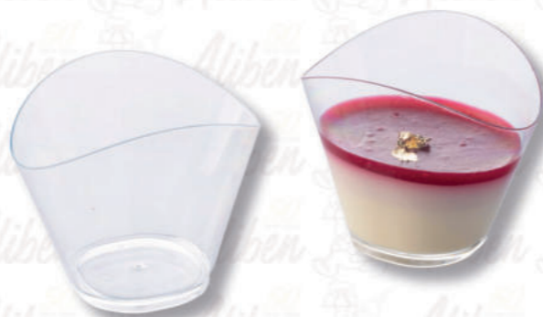
COPPETTA WAVE 120 ML Cod. 0009473 | Conf. da 100 pezzi