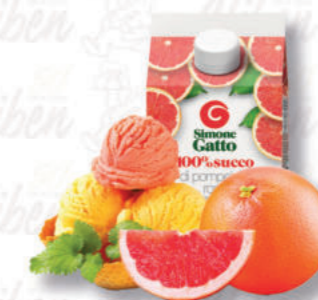
SUCCO POMPELMO ROSA Cod. 0005486 | 500 g