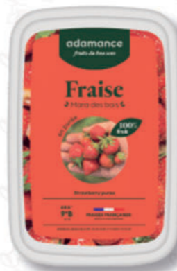
PUREA FRAGOLA MARA DES BOIS Cod. 0009336 | 1 Kg