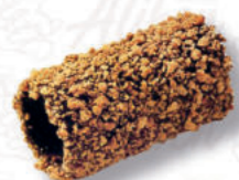
CANNOLI 19/5 AMARETTO Cod. 0004759 | 3,2 Kg Peso al pezzo: 15 g N° pezzi per confezione: 196