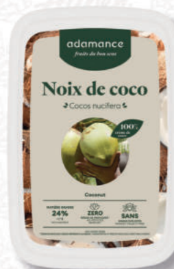
PUREA COCCO Cod. 0009340 | 1 Kg