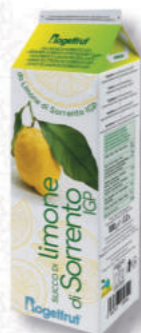
SUCCO LIMONE DI SORRENTO Cod. 0004087 | 1 Kg