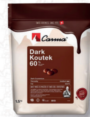
DARK KOUTEK 60% Cod. 0009582 | 1,5 Kg

Cioccolato fondente naturalmente nero, dal sapore intenso ma armonioso e adatto ai vegani.