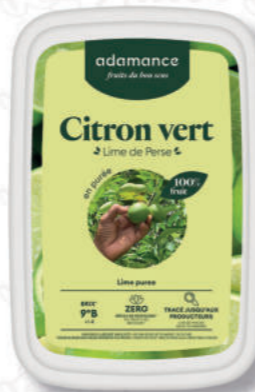
PUREA LIME Cod. 0009575 | 1 Kg