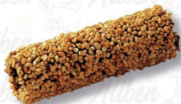
CANNOLI 19/10 RISO Cod. 0004082 | 2,45 Kg Peso al pezzo: 29 g N° pezzi per confezione: 84