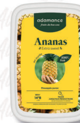
PUREA ANANAS Cod. 0010313 | 1 Kg