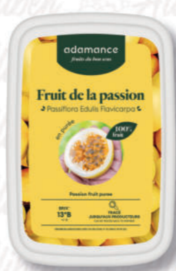
PUREA FRUTTO DELLA PASSIONE Cod. 0009346 | 1 Kg