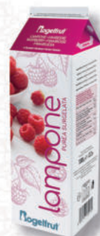
PUREA LAMPONE 10% Cod. 286 | 1 Kg

Le puree e i succhi di frutta sono un grande classico della produzione Rogelfrut. Una ricetta naturale senza coloranti né conservanti: 90% di polpa di frutta e 10% di zucchero o 100% di frutta. La frutta viene lavorata attraverso un processo artigianale che permette di preservarne tutte le peculiarità, nel rispetto della natura.