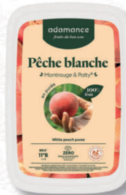
PUREA PESCA BIANCA Cod. 0009333 | 1 Kg