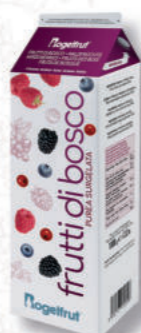
PUREA FRUTTI DI BOSCO 10% Cod. 0007454 | 1 Kg