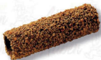
CANNOLI 19/10 AMARETTO Cod. 0004177 | 3,5 Kg Peso al pezzo: 31 g N° pezzi per confezione: 112