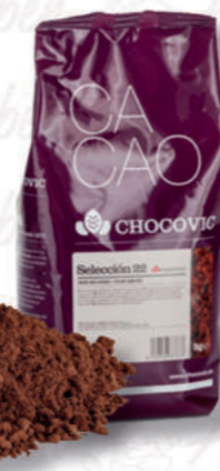
CACAO SELECCIÓN 22 Cod. 0004910 | 1 Kg

Cioccolato fondente di copertura al 59,5% in pastiglie.