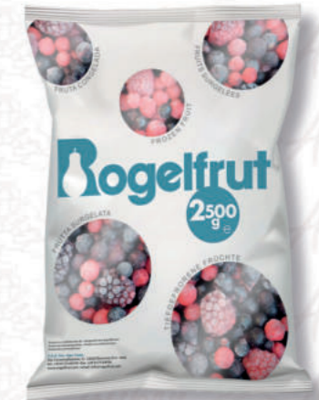
MISTO BOSCO 4 FRUTTI Cod. 0003529 | 2,5 Kg