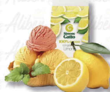
SUCCO LIMONE Cod. 0005484 | 500 g