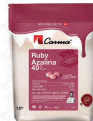
RUBY AZALINA 40% Cod. 0009387 | 1,5 Kg

Il cioccolato di copertura più bianco sul mercato. Consistenza vellutata e che si scioglie in bocca, grazie all'uso della panna svizzera.