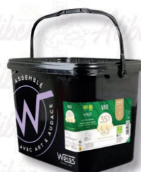
BIANCO VAO 35% Cod. 0009693 | 5 Kg

Colore rubino unico, ottenuto da fave di cacao appositamente selezionate. Consistenza cremosa tipica del cioccolato svizzero, coronata da note fruttate.