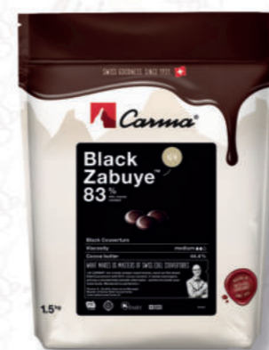
BLACK ZABUYE 83% Cod. 0009410 | 1,5 Kg

Ideale per la realizzazione di ganache, bevande al cioccolato, mousse, topping e sale.