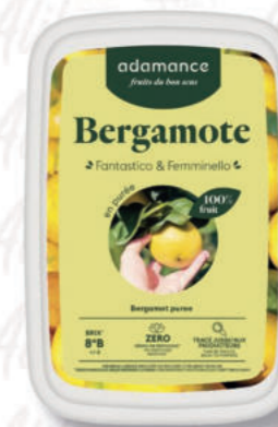
PUREA BERGAMOTTO Cod. 0010091 | 1 Kg