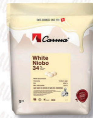
WHITE NIOBO 34% Cod. 0010606 | 5 Kg

Cacao pregiato, latte svizzero, caramello e malto: un'armonia di sapori. Premio Miglior cioccolato di copertura al latte dell'Accademia Maestri Pasticceri Italiani.