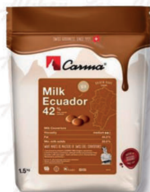
MILK ECUADOR 42% Cod. 0009537 | 1,5 Kg

Copertura minimo 70% di cacao con il 44% di burro di cacao dal gusto rotondo e molto equilibrato, per i veri amanti del cioccolato fondente.