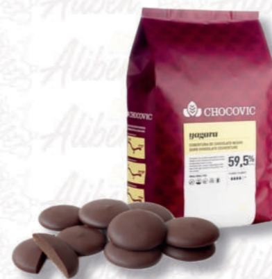
YAGARA CIOCCOLATO FONDENTE 59,5% Cod. 0004879 | 5 Kg

Cioccolato fondente al 64,5% min di cacao con un'ottima fluidità.