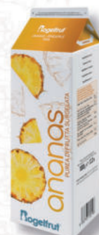
SUCCO ANANAS Cod. 0004601 | 1 Kg