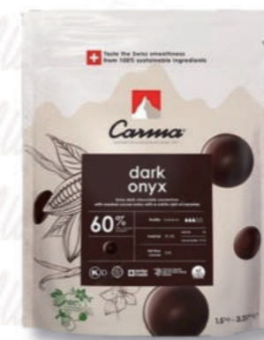
DARK ONYX 60% Cod. 0010690 | 1,5 Kg

Realizzato interamente con cacao del Madagascar. Sapore intenso di cacao con note di frutti rossi e agrumi.