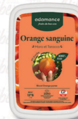
PUREA ARANCIA ROSSA Cod. 0009878 | 1 Kg