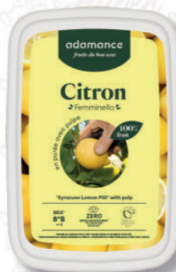
PUREA LIMONE Cod. 0009875 | 1 Kg