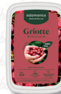
PUREA AMARENA Cod. 0010312 | 1 Kg