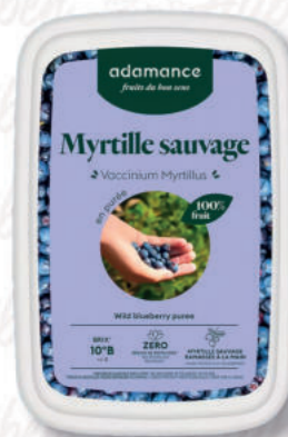
PUREA MIRTILLO Cod. 0009576 | 1 Kg