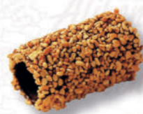
CANNOLI 19/5 RISO Cod. 0004757 | 2,65 Kg Peso al pezzo: 15 g N° pezzi per confezione: 168