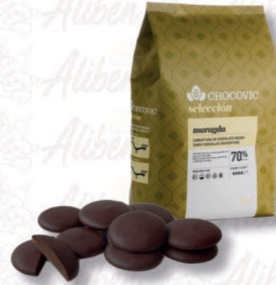
MARAGDA CIOCCOLATO FONDENTE 70% Cod. 0004876 | 5 Kg

Cioccolato al latte dal gusto morbido e delicato con persistente aroma di latte.