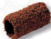
CANNOLI 19/5 CACAO Cod. 0004761 | 2,4 Kg Peso al pezzo: 12 g N° pezzi per confezione: 196