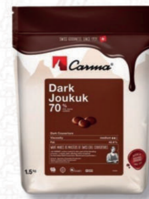
DARK JOUKUK 70 % Cod. 0010605 | 1,5 Kg

Copertura bianca e lattiginosa con forti note di vaniglia. Durata di conservazione 18 mesi.