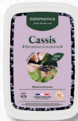
PUREA RIBES NERO Cod. 0009338 | 1 Kg