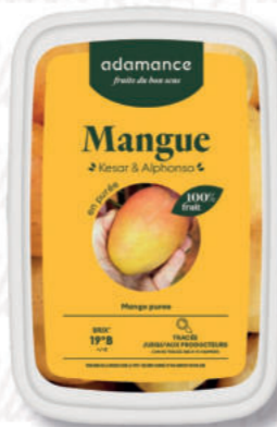
PUREA MANGO Cod. 0009341 | 1 Kg