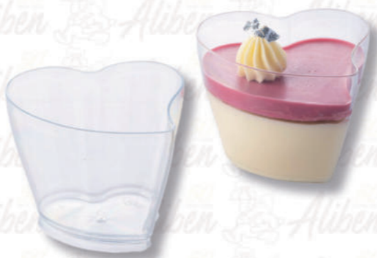
BICCHIERINO HEART 100 ML Cod. 0009734 | Conf. da 100 pezzi