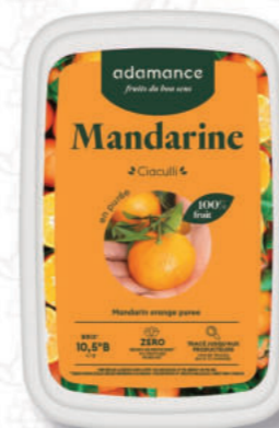
PUREA MANDARINO Cod. 0009877 | 1 Kg