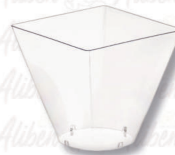
MINI DESSERT PRESTIGE 200 CC TRASPARENTE Cod. 0011052 | Conf. da 50 pezzi