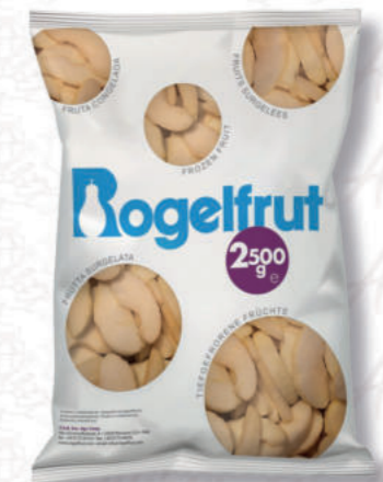
MELE A FETTE Cod. 0003871 | 2,5 Kg