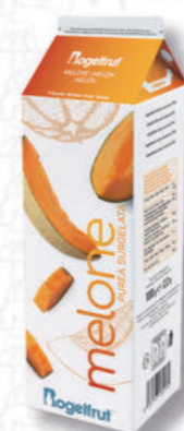
PUREA MELONE Cod. 0007412 | 1 Kg