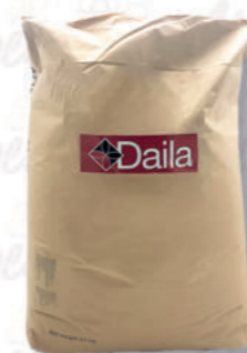
GLUCOSIO DISIDRATATO DE 29/31 Cod. 0010993 | 25 Kg

Lo sciroppo di glucosio disidratato, derivato dall'amido di mais, è un anticongelante con basso potere dolcificante, ottimo per la gelateria dove ottimizza il controllo dell'acqua in mantecazione. La sua forma in polvere consente un dosaggio preciso e una facile solubilità. Migliora l'estrusione, la finezza dei cristalli e la stabilità. È impiegato anche in pasticceria e come lucidante. Si conserva per 24 mesi in luogo fresco e asciutto.