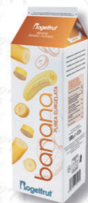
PUREA BANANA Cod. 394 | 1 Kg