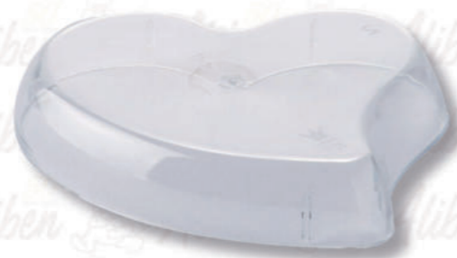
COPERCHIO HEART Cod. 0009736