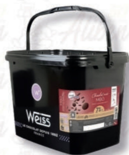
MBO FONDENTE 71% Cod. 0009450 | 5 Kg

È una bella complessità aromatica, dalle note rosso scuro si caratterizza per un'ottima fluidità e facilità di lavorazione.