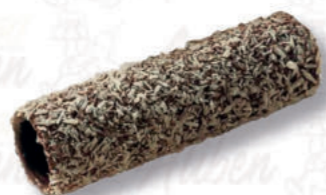
CANNOLI 19/10 COCCO Cod. 0004176 | 3,1 Kg Peso al pezzo: 28 g N° pezzi per confezione: 112