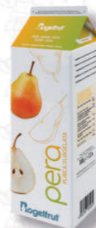
PUREA PERA Cod. 0006218 | 1 Kg