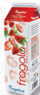
PUREA FRAGOLA 10% Cod. 0004085 | 1 Kg