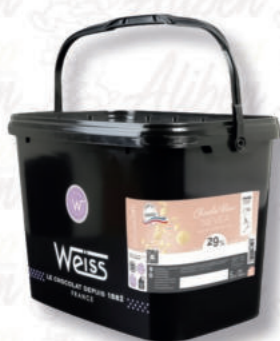
BIANCO NEVEA 29% Cod. 0007122 | 5 Kg

Chiaro gusto di cacao e delicate note di vaniglia. Sentori di frutti di bosco con un leggero gusto amaro.