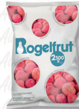
FRAGOLE SENG SENGANA Cod. 841 | 2,5 Kg

Cacao in polvere alcalinizzato rosso scuro. Certificazione Kosher riportata anche sulla confezione.