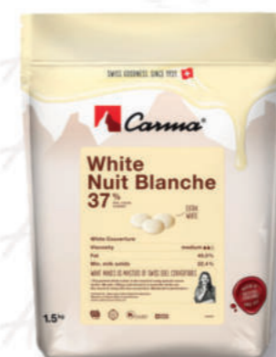
WHITE NUIT BLANCHE 37% Cod. 0009411 | 1,5 Kg

Una copertura di cioccolato bianco dal colore più chiaro e poco zuccherata che accarezza il palato grazie al suo gusto di latte fresco e rotondo.