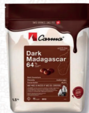
DARK MADAGASCAR 64% Cod. 0010607 | 1,5 Kg

Elevato contenuto di cacao e pochi zuccheri. Senza lecitina di soia.