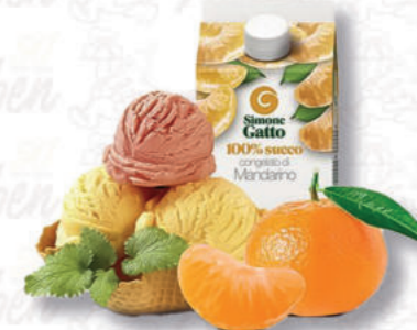
SUCCO MANDARINO Cod. 0005683 | 500 g