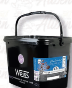
GALAXIE AL LATTE 41% Cod. 0007115 | 5 Kg

Dall'aroma lattico e leggermente vanigliato, questo cioccolato lascia in bocca il profumo di latte caramellato.