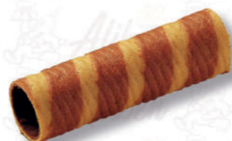
CANNOLI 19/10 WAFER CACAO Cod. 0007209 | 2 Kg Peso al pezzo: 14 g N° pezzi per confezione: 144