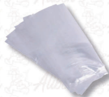
SACCHETTI PER GHIACCIOLI Cod. 0008672 | Conf. da 100 pezzi Dimensioni: 80x120 mm