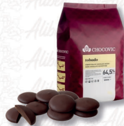
TOBADO CIOCCOLATO FONDENTE 64,5% Cod. 0004912 | 5 Kg

Copertura di cioccolato fondente dal sapore deciso e puro con un leggero punto di acidità.