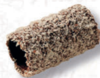
CANNOLI 19/5 COCCO Cod. 0004135 | 3,6 Kg Peso al pezzo: 16 g N° pezzi per confezione: 224