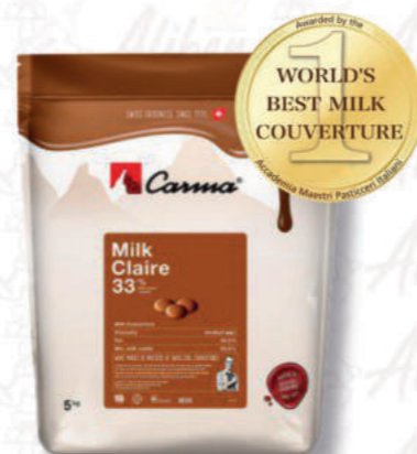
MILK CLAIRE 33% Cod. 0009407 | 5 Kg

Senza coloranti o aromi artificiali. Un bel colore dorato con un fantastico gusto caramello fatto con amore e dedizione.