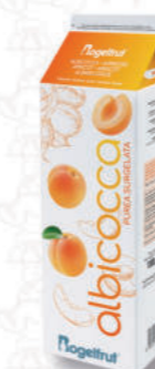
PUREA ALBICOCCA 10% Cod. 0003640 | 1 Kg