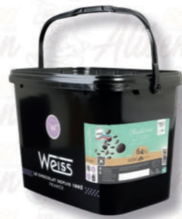
LICHU FONDENTE 64% Cod. 0007117 | 5 Kg

Le note iniziali leggermente acide e legnose, lasciano il posto ad una marcata amarezza, bilanciata da aromi di frutta secca tostata.