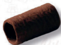
CANNOLI 19/5 RICOPERTI Cod. 0004137 | 4 Kg Peso al pezzo: 15 g N° pezzi per confezione: 256